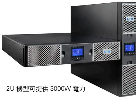
2U 機型可提供 3000W 電力